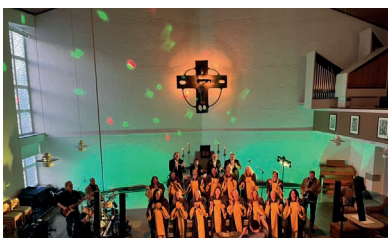
Gospelkonzert „Joy in Belief“