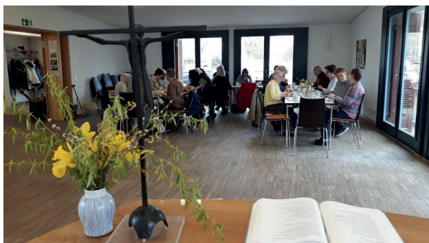
Gemütliches Frühstück nach dem Sonntagsbrunch-Gottesdienst in der Osterwoche

Die Band der Offenen Behindertenarbeit vor Ort Mittwoch, 17 bis 18.30 Uhr Kontakt: Julia Flötemann, Tel. 67 53 450 Bitte vorher anmelden!