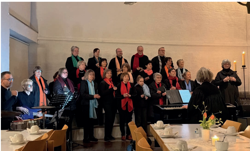
Projektchor Dörfles-Esbach in der Osternacht