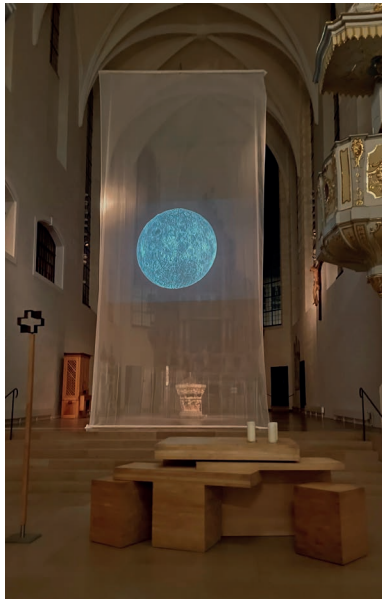
Zur Museumsnacht scheint der Mond in die Moritzkirche wie hier 2025